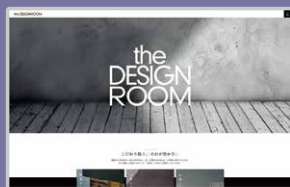
ホームページ(独自ドメイン)