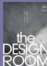
タブロイド紙 100部(12ページ)