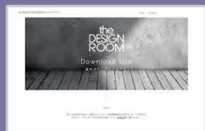
資料ダウンロードサイト